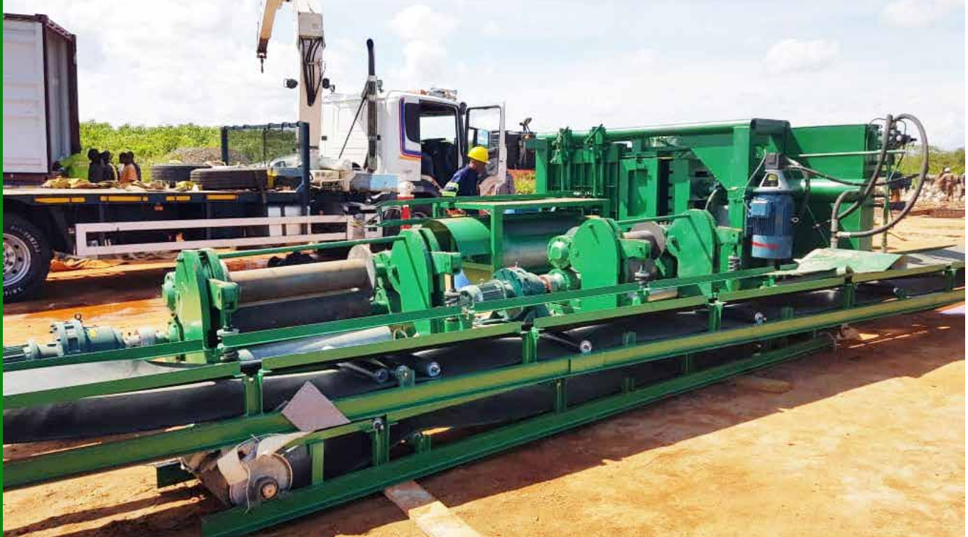
Mashine ya kuchakata Mkonge (korona) ikiwa imeshushwa tayari kwa kusimikwa katika eneo la Taula Kituo cha Handeni mkoani Tanga.